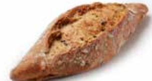
205736 PETIT PAIN TRADI-TOURNESOL 80g COUNTRY SUNFLOWER ROLL 80g