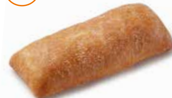
202048 CIABATTA SANDWICH CIABATTA SANDWICH