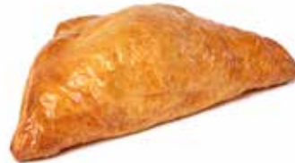
200651 POCHE AUX POMMES APPLE DANISH

KG 95g | 52 | 63 | 15' | 170° | 18 - 20'