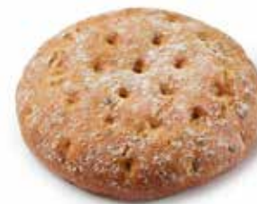
203441 FLAGUETTE™ TOMATES ET OLIVES FLAGUETTE™ TOMATOES AND OLIVES