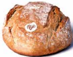
214429 BOULE BIO CAMPAGNE ROUND BIO COUNTRY BREAD