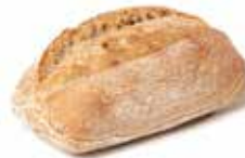
214430 PETIT PAIN BIO CAMPAGNE BIO COUNTRY ROLL