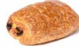
200650 PAIN AU CHOCOLAT PAIN AU CHOCOLAT

KG 85g | 68 | 63 | 15' | 170° | 18 - 20'