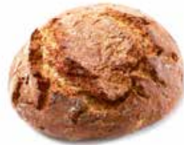
204081 CAMPAGNARD ÉPEAUTRE ROND ROUND SPELT FARMER'S LOAF