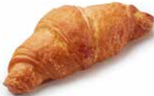
201162 MINI-CROISSANT MINI CROISSANT