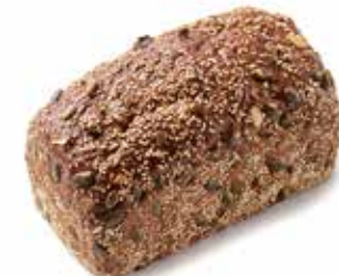
204678 PAIN AUX FRUITS FRUIT LOAF