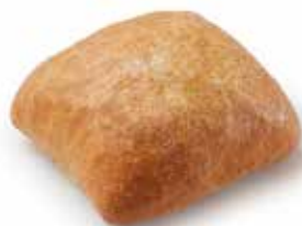
200568 CIABATTA 80g CIABATTA 80g