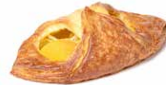
200664 POCHE AUX ABRICOTS APRICOT DANISH

KG 95g | 60 | 63 | 15' | 170° | 18 - 20'