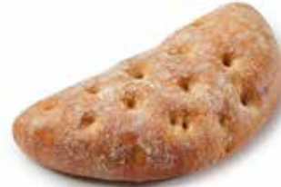
208343 DEMI-FLAGUETTE™ TOMATES ET OLIVES HALF FLAGUETTE™ TOMATOES AND OLIVES