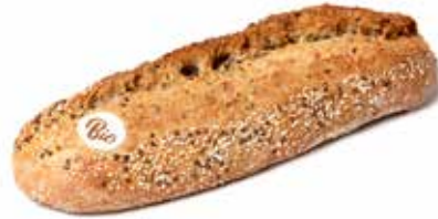
214427 BÛCHERON BIO MULTI-CÉRÉALES LUMBERJACK BIO MULTI-GRAIN