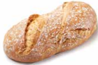
203491 PAIN RUSTIQUE COUNTRY LOAF