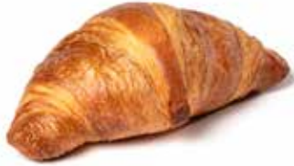
200649 CROISSANT CROISSANT

KG 65g | 68 | 63 | 15' | 170° | 18 - 20'