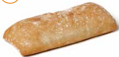
214424 CIABATTA SANDWICH 130g CIABATTA SANDWICH 130g