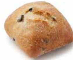
201654 PETIT PAIN TRADI-OLIVES BLACK OLIVE ROLL