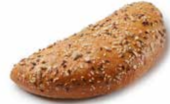
212108 DEMI-FLAGUETTE™ AUX GRAINES HALF FLAGUETTE™ WITH TOPPING