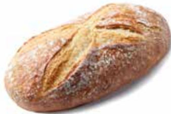
212573 PAIN CAMPAGNE GOURMET GOURMET COUNTRY BREAD