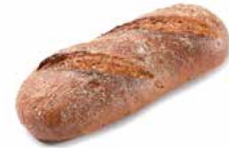
206899 PAIN RUSTIQUE MULTI-CÉRÉALES 450g MULTI-GRAIN COUNTRY LOAF 450g