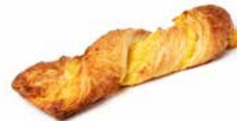
206514 TORSADE COCO-ANANAS COCONUT-PINEAPPLE TWIST

KG 100g | 52 | 63 | 15' | 170° | 18 - 20'