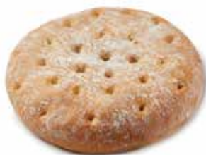
203439 FLAGUETTE™ NATURE FLAGUETTE™ WHITE