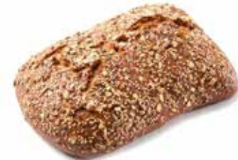
204098 PAIN SIX-GRAINS SIX-GRAIN LOAF