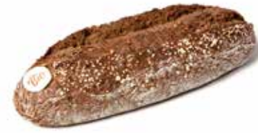
214428 BÛCHERON BIO MAXI-GRAINS LUMBERJACK BIO POWER-GRAIN