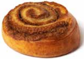
214432 ROULÉ CANNELLE (MARGARINE) CINNAMON ROLL (MARGARINE)