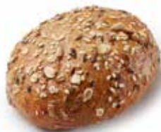
211427 PETIT PAIN TRADI ROND AUX GRAINES ROUND MULTI-GRAIN ROLL