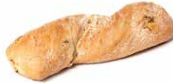
214425 TORSADE AUX OLIVES VERTES TWIST WITH GREEN OLIVES