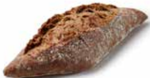
205735 PETIT PAIN TRADI-MAXI-GRAINS 80g POWER-GRAIN ROLL 80g