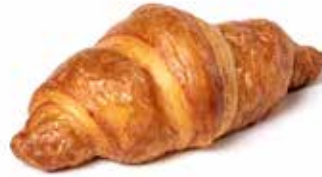
201029 CROISSANT PRALINÉ PRALINE CROISSANT

KG 65g | 68 | 63 | 15' | 170° | 18 - 20'