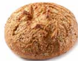
211250 PAIN SOLEIL CÉRÉALES MEDITERRANEAN GRAIN BREAD