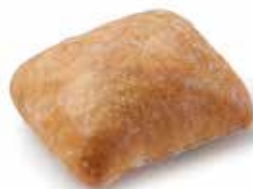
204079 CIABATTA 60g CIABATTA 60g