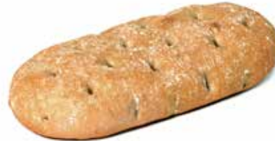
213198 FLAGUETTE™ OVALE OVAL FLAGUETTE™