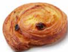
201164 MINI-PAIN AUX RAISINS MINI RAISIN ROLL