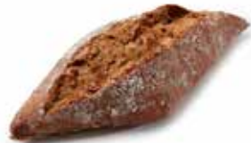
205737 PETIT PAIN TRADI-GRAINS 80g MULTI-GRAIN COUNTRY ROLL 80g