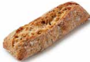
201653 LONGUET TRADI-TOURNESOL MINI SUNFLOWER ROLL