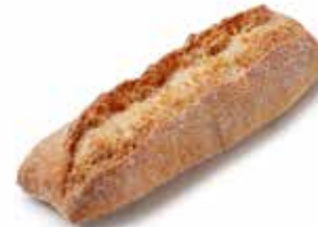
201652 LONGUET TRADI-SON MINI BRAN ROLL