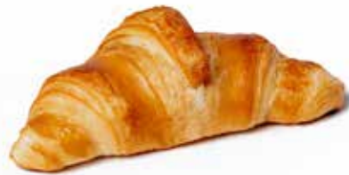
210724 CROISSANT ENTIÈREMENT CUIT FULLY-BAKED CROISSANT