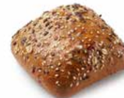
203138 PETIT PAIN KÖRNLI (MULTI-GRAINS) KÖRNLI (MULTI-GRAIN) ROLL