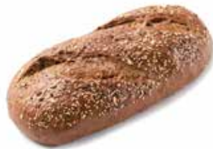
206898 PAIN MAXI-GRAINS 450g POWER-GRAIN LOAF 450g