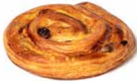
200648 PAIN AUX RAISINS RAISIN ROLL

KG 85g | 68 | 63 | 15' | 170° | 18 - 20'