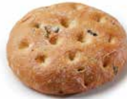
205074 MINI-FLAGUETTE™ AUX OLIVES MINI-FLAGUETTE™ WITH OLIVES