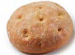
211528 FLAGUETTE™ BURGER BURGER FLAGUETTE™