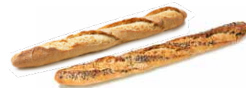
213204 BAGUETTE CAMPAGNE GOURMET GOURMET COUNTRY BAGUETTE