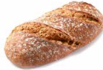
203490 PAIN RUSTIQUE MULTI-CÉRÉALES MULTI-GRAIN COUNTRY LOAF