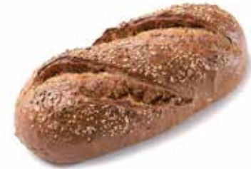
203218 PAIN MAXI-GRAINS POWER-GRAIN LOAF