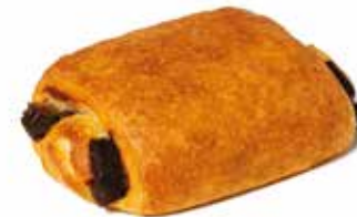
205742 PAIN AU CHOCOLAT ENTIÈREMENT CUIT FULLY-BAKED PAIN AU CHOCOLAT