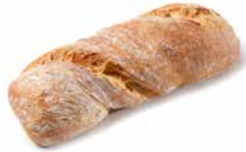
206900 PAIN TORSADE TWISTER LOAF