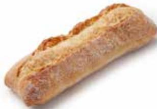
203569 LONGUET TRADI-NATURE MINI SOURDOUGH ROLL