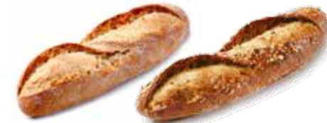
208090 BAGUETTE RUSTIQUE NATURE 140g RUSTICAL BAGUETTE WHITE 140g