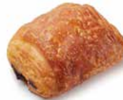
201163 MINI-PAIN AU CHOCOLAT MINI PAIN AU CHOCOLAT