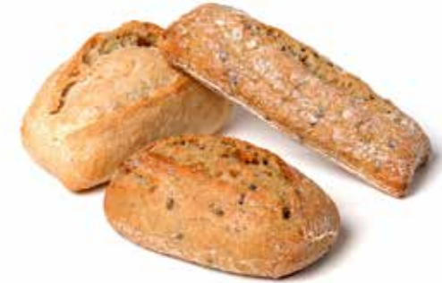
202738 TRADI-MIX 20 Petits Pains Tradi-Nature 20 Petits Pains Tradi-Grains 20 Longuets Tradi-Tournesol

MINI ROLL MIX 20 Country Roll 20 Multi-Grain Country Roll 20 Mini Sunflower Roll