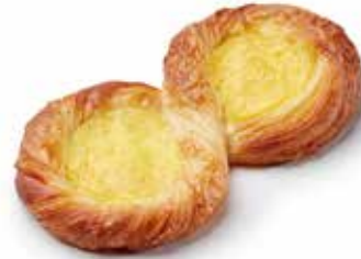
201161 HUIT (MARGARINE) EIGHT (MARGARINE)