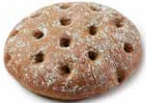
209744 MINI-FLAGUETTE™ MULTI-CÉRÉALES MINI-FLAGUETTE™ MULTI-GRAIN