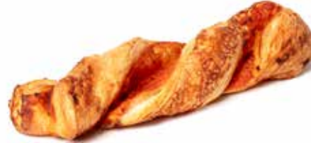
214249 TORSADE MOZZARELLA-TOMATE TWIST MOZZARELLA-TOMATO