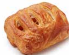
201255 MINI-STRUDEL AUX POMMES MINI APPLE STRUDEL