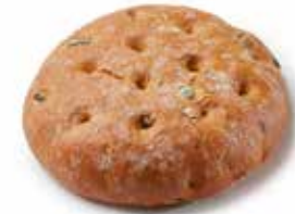
205076 MINI-FLAGUETTE™ TOMATES ET OLIVES MINI-FLAGUETTE™ TOMATOES AND OLIVES