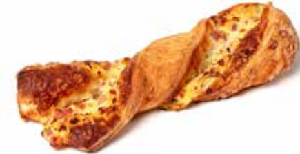
213205 TORSADE JAMBON-FROMAGE TWIST HAM-CHEESE