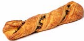
201069 TORSADE CRÈME-CHOCOLAT CHOCO TWIST

KG 130g | 52 | 63 | 15' | 170° | 18 - 20'