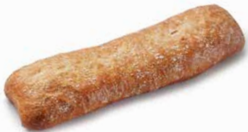
201081 CIABATTA CIABATTA