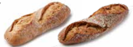
212530 DEMI-BAGUETTE SANDWICH NATURE SANDWICH BAGUETTE WHITE