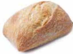
211689 PETIT PAIN À L'ANCIENNE OLD-STYLE ROLL