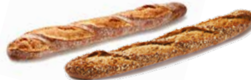
208082 BAGUETTE RUSTIQUE NATURE 280g RUSTICAL BAGUETTE WHITE 280g