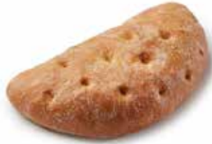
208342 DEMI-FLAGUETTE™ NATURE HALF FLAGUETTE™ WHITE