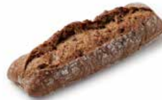
206779 LONGUET TRADI-MAXI-GRAINS MINI POWER-GRAIN ROLL