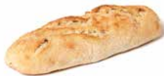
213207 DEMI-BAGUETTE GOURMET GOURMET SANDWICH BAGUETTE