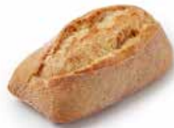
201403 PETIT PAIN TRADI-NATURE COUNTRY ROLL