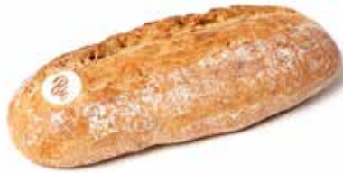
214426 BÛCHERON BIO NATURE LUMBERJACK BIO