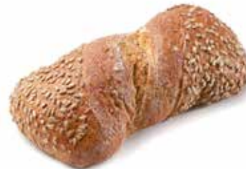
205070 PAIN DES ALPES GRAIN TWIST