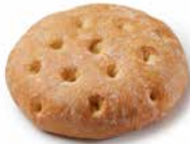
205075 MINI-FLAGUETTE™ NATURE MINI-FLAGUETTE™ WHITE