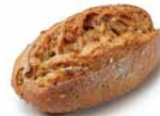
201406 PETIT PAIN TRADI-GRAINS MULTI-GRAIN COUNTRY ROLL