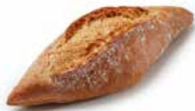
205738 PETIT PAIN TRADI-NATURE 80g COUNTRY ROLL 80g