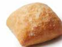
200582 CIABATTA 40g CIABATTA 40g