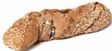
212884 TORSADE AUX FRUITS FRUIT TWIST