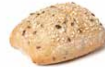
214431 PETIT PAIN BIO MULTI-CÉRÉALES BIO MULTI-GRAIN ROLL