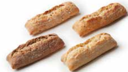
207127 LONGUET-MIX 20 Longuets Tradi-Tournesol 20 Longuets Tradi-Maxi-Grains 20 Longuets Tradi-Nature 20 Longuets Tradi-Son

MINI ROLL MIX 20 Mini Sunflower Roll 20 Mini Power-Grain Roll 20 Mini Sourdough Roll 20 Mini Bran Roll