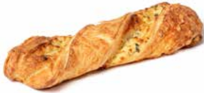
214169 TORSADE FROMAGE TWIST CHEESE